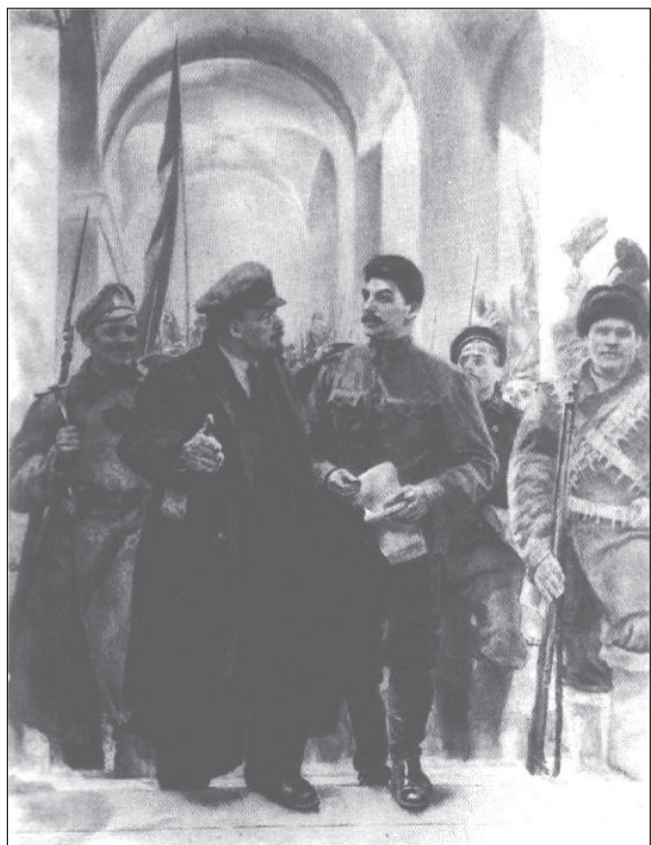
24 октября 1917. Смольный. (С картины художника У. Кибрика).

В стране действовала и так называемая «новая оппозиция». Репрессированный в 1937 г. родной брат известного художника Б.Ефимова – Кольцов (Фридлянд) на одном из допросов рассказал о планах новой оппозиции следующее: «... На троцкистов и бухаринцев рассчитывать не приходится, ибо все эти люди конченные и связь с ними гибельна, но в стране... имеются новые кадры недовольных и жаждущих контактов с Западной Европой молодых интеллигентов... Новая конституция в корне изменит обстановку политической борьбы, очень многое упростит и легализует, так что будет безопаснее добиваться поставленных целей, используя для давления на правительство парламентские формы. Наркомы и целые