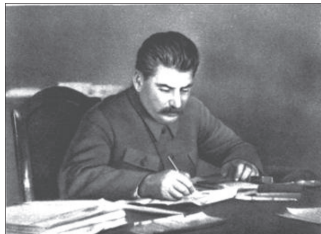
И.В. Сталин в рабочем кабинете. Фото.