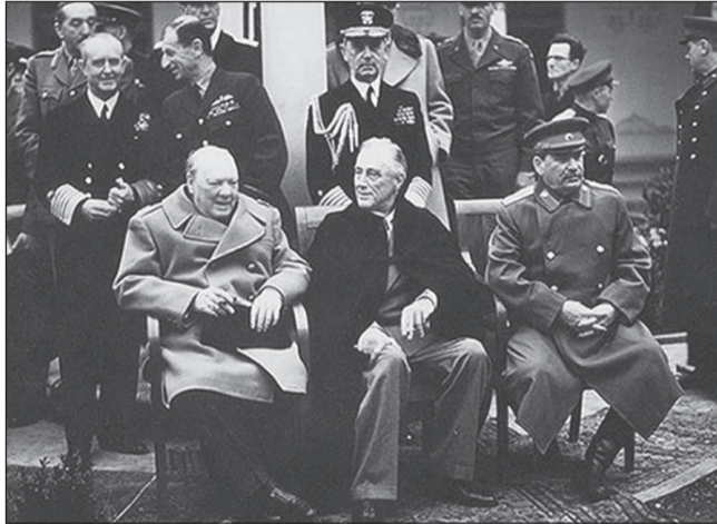
И.В. Сталин на Ялтинской конференции. 1945 г.

6 мая 1941 года И.В. Сталин становится Председателем Совета Народных Комиссаров СССР. В начале Великой Отечественной войны Советского Союза И.В. Сталин был назначен Председателем Государственного Комитета Обороны, народным комиссаром обороны, Верховным Главнокомандующим Вооружёнными Силами СССР и оста-