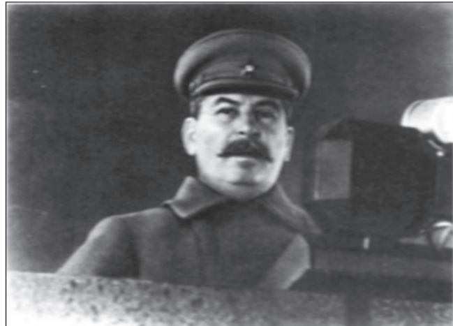
И.В. Сталин выступает на параде Красной Армии на Красной площади в Москве 7 ноября 1941 г. Фото.

Сталин, получая списки «врагов народа» от Хрущёва, отвечал ему – «Уймись, Никита», требовал подробного обоснования привлечения к ответственности лиц из списка и резкого со-