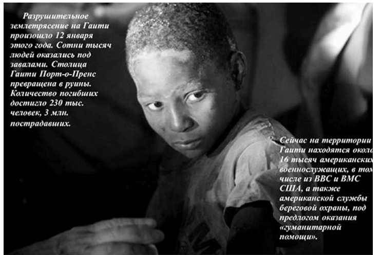
Разрушительное землетрясение на Гаити произошло 12 января этого года. Сотни тысяч людей оказались под завалами. Столица Гаити Порт-о-Пренс превращена в руины. Количество погибших достигло 230 тыс. человек, 3 млн. пострадавших.

В ходе операции была опробована система TISC - Программа сотрудничества и обмена транснациональной информацией, предполагающая совместные действия армии и НПО. Последующее «гуманитарное» вторжение американцев, обоснованное Вашингтоном необходимостью контроля за территорией в условиях недееспособности местной власти, вызвало крайнюю тревогу в Латинской Америке. Ещё большую тревогу вызвала информация об «экспериментальном» характере землетрясения, распространённая несколькими испаноязычными СМИ. Через несколько дней после катастрофы венесуэльский государственный телеканал ViveTV, ссылаясь на доклад, подготовленный Северным флотом России, опубликовал на своём сайте сообщение о том, что землетрясение на Гаити явилось результатом испытания сейсмического оружия, проведенного Четвёртым флотом США. Такое оружие планируется применить против