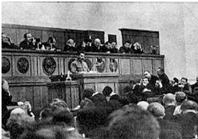
Выступление И.В. Сталина на XVII Съезде ВКП(б)

Вопросы идейно-политического руководства занимали важное место в докладе тов. Сталина. Он предупреждал партию, что хотя враги партии, оппортунисты всех мастей, национал-уклонисты всякого рода разбиты, но остатки их идеологии живут еще в головах отдельных членов партии и нередко дают о себе знать. Пережитки капитализма в экономике и особенно в сознании людей являются благоприятной почвой для оживления идеологии разбитых антиленинских групп. Сознание людей в его развитии отстает от их экономического положения. Поэтому пережитки буржуазных взглядов в головах людей остаются и будут еще оставаться, хотя капитализм в экономике уже ликвидирован. При этом нужно учесть,