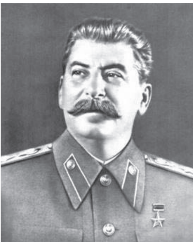
5 марта 1953 года умер Иосиф Виссарионович Сталин, продолжатель дела великого Ленина, вождь и руководитель Коммунистической партии большевиков и Советского государства, выдающийся полководец, под руководством которого была разгромлена гитлеровская Германия, освобождены народы Европы от коричневой чумы фашизма, спасен мир от фашистского рабства.

Вот и все! Добили закон академики! Очень скоро эти мутанты от МВФ отбросят социалистическую терминологию и поведут страну в рабство, в капитализм XVIII века; реализовывать задумки Даллеса: "Окончится война, все как-то утрясется, устроится. И мы бросим все, что имеем, чем располагаем ... все золото, всю материальную мощь на обольванивание и одурачивание людей! Человеческий мозг, сознание лю-