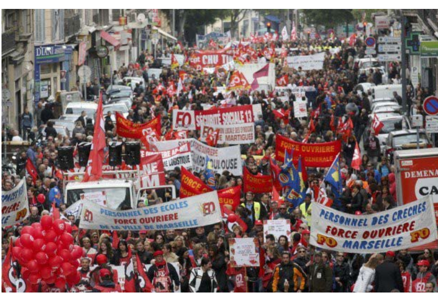
ональная и антисоциальная. В ней можно увидеть позорные черты версальца Тьера, проитглеровских коллаборационистов и всех тех, кто ради выкачивания прибыли из своей страны склоняется к наихудшему диктату крупного капитала, чтобы подавить народную борьбу.

Текущее положение показывает, что коммунистические активисты PRCF предлагают верную линию. Да, классовая борьба в нашей стране обостряется. Да, рабочие будут учиться отвечать ударом на удар фашиствующей буржуазии. Да, они возвращаются к боевым профсоюзам, увидев бездействие «жел-